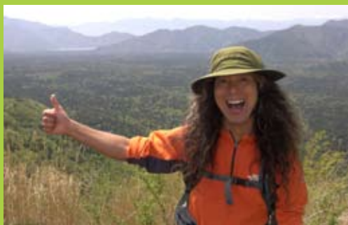
福田六花オフィシャルウェブサイト http://www7a.biglobe.ne.jp/~ricka/